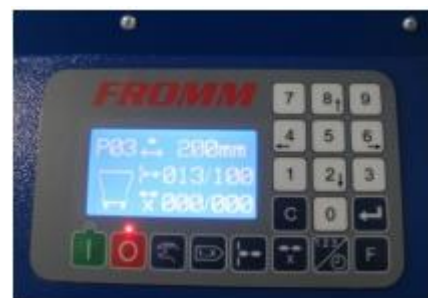
Ľahko ovládateľný riadiaci panel

Napájanie: 115 / 230V - 50 / 60Hz Veľkosti vankúšov: 120 – 400 mm programovateľné Šírka filmu: 210 mm Hrúbka filmu: 25my - 50my Kvalita filmu: PE nízkej a vysokej hustoty Zložený film / nie rolky