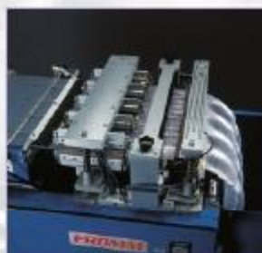
tlak vzduchu –zvary – perforácia