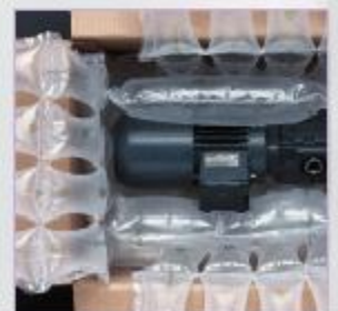
nekompromisné fixovanie (výrobku)