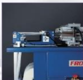
2 pásy fólie