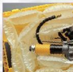
nepotrebný vnútorný obal