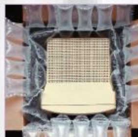
schopnosť vysokého pohlcovania úderov