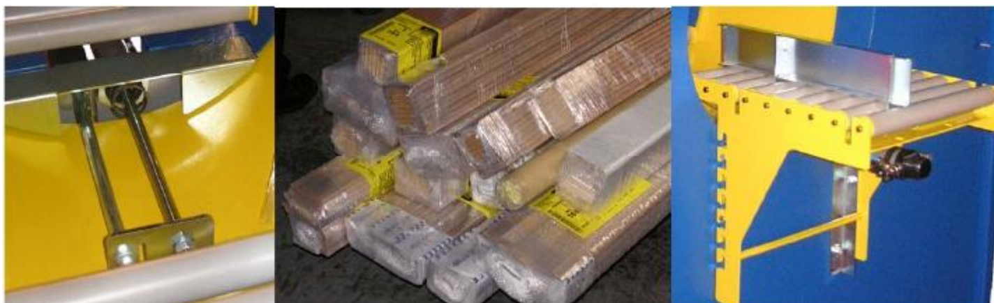
EasyWrap™ FV205 Poloautomatický , vertikální stroj Ovíjecí stroj na malé svazky